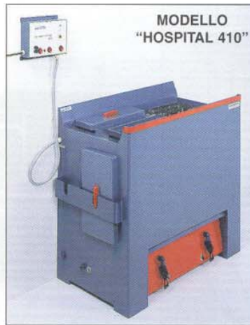
MODELLO "HOSPITAL 410"

I comandi elettrici, di entrambe le vasche sono concentrati nel "quadro elettronico control 400" da installare a muro in zona protetta, comprendono: - la selezione delle temperature di esercizio - la inserzione delle elettrovalvole - le segnalazioni di sicurezza termica - interruttore generale e fusibili